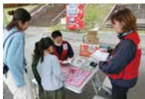
防災すごろくの体験コーナー