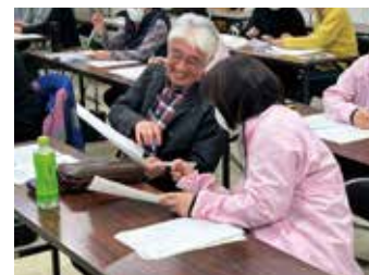
聴いたことを絵にする演習