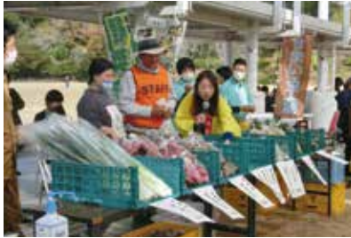
新鮮な野菜がズラリ

10月29日に、赤い羽根共同募金啓発を目的に、第18回菊池こころのネットワークフェアを開催しました。「誰もが安心して暮らすことのできる地域づくり」を目指し、地域の方々と共につくりあげるイベントです。晴天に恵まれ多くの方々にご来場いただき、年齢や障がいの有無などを超えた温かな交流が生まれました。