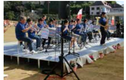
OBとともに、北中吹奏楽部の演奏