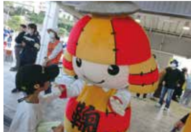
ころうくんも来たよ