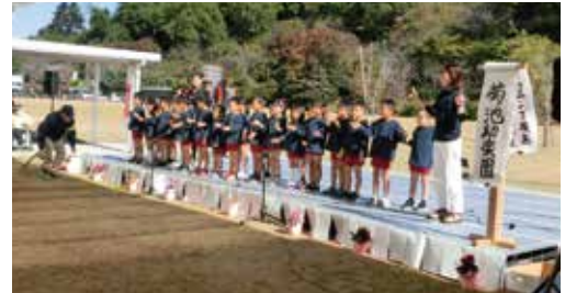
元気な声で開会のあいさつをしてくれました