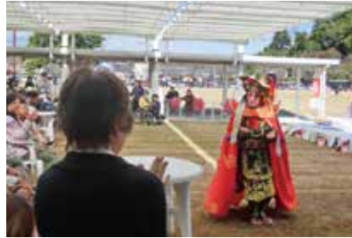
盛り上がりました！変面ショー